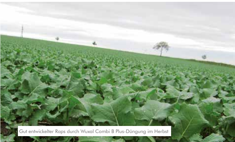
Gut entwickelter Raps durch Wuxal Combi B Plus-Düngung im Herbst

Im Herbst ab dem 4-Blattstadium gemeinsam mit Insektiziden, Herbiziden, Fungiziden bzw. Wachstumsreglern.