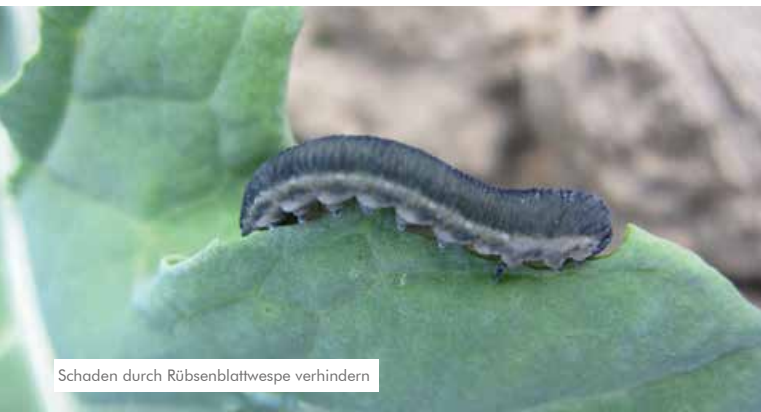
Schaden durch Rübsenblattwespe verhindern

Mit Cymbigon Forte im Herbst sicher Erdfloh und Rübsenblattwespe bekämpfen. Kombinierbar mit Blattdüngung 2 l Wuxal Combi B Plus. Im Frühjahr optimal gegen Rapsstängel- und Kohltrieb-rüssler in Kombination mit AZO-SPEED und oder Wuxal Schwefel einsetzen.