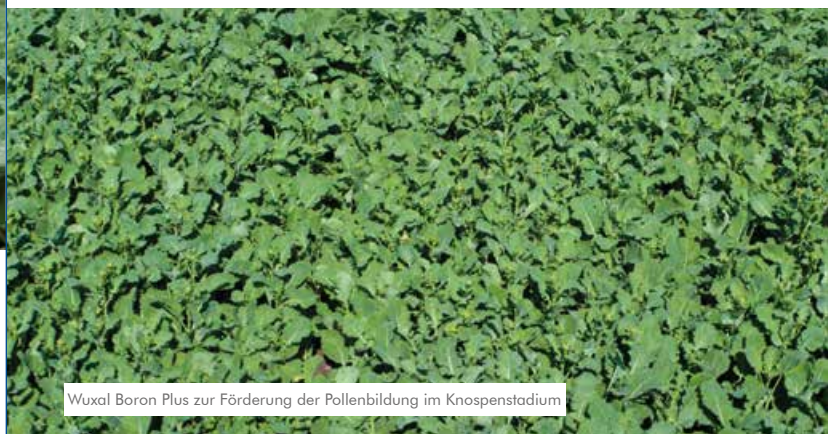
Wuxal Boron Plus zur Förderung der Pollenbildung im Knospenstadium

Gemeinsam mit der Schädlingsbekämpfung im Herbst oder Frühjahr.