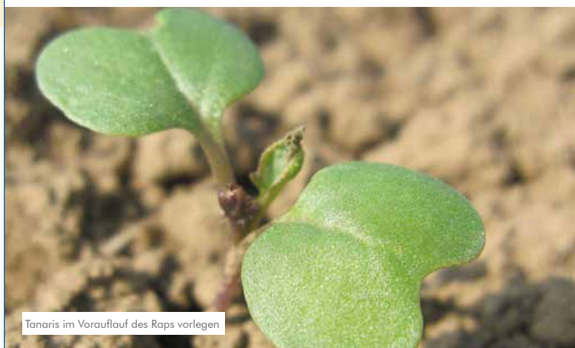
Tanaris im Voraufbau des Raps vorlegen

Tanaris bekämpft viele Unkräuter inkl. Klettenlabkraut und Hundspetersilie sowie Unkrauthirsen. Es wird über Wurzeln, Hypokotyl, Keimblätter und Laubblätter aufgenommen. Deshalb erfasst Tanaris aufgelaufene, im Auflaufen befindliche Pflanzen in den frühen Stadien. Ausreichende Feuchtigkeit verbessert die Bodenwirkung.