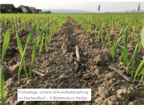
Frühzeitige, sichere Unkrautbekämpfung im Nachauflauf – 3-Blattstadium Herbst.