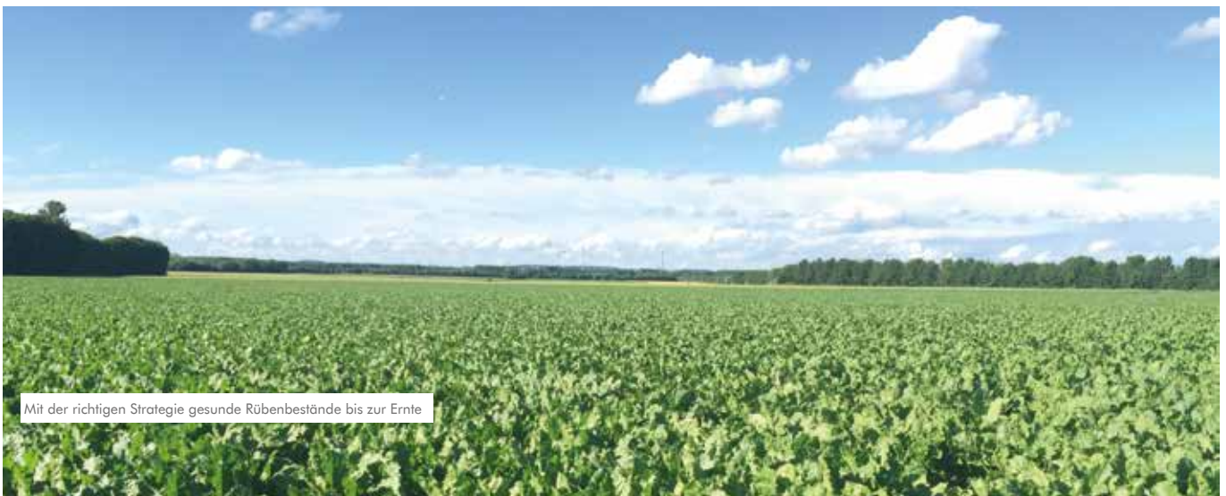
Mit der richtigen Strategie gesunde Rübenbestände bis zur Ernte