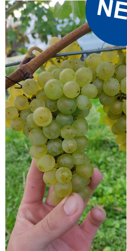
16 Florgib Tabletten /10.000m 2